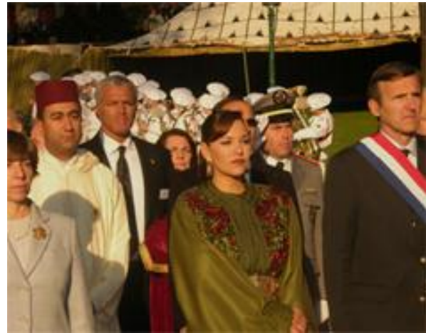
S.A.R la Princesse Lalla Hasna à l'inauguration de la Fontaine 'Mémorial Mohammed V' à Aix-Les-Bains, le 20 novembre 2005.

de ferronnerie, tisserants et calligraphes ont animé une médina reconstruite sur place, tandis qu'une fantasia était organisée.