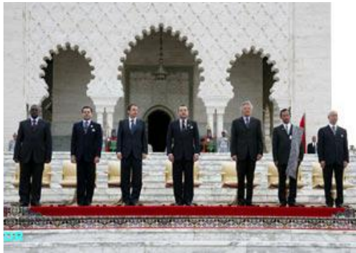
S.M. le Roi Mohammed VI entouré de ses Illustres Hôtes, sur l'esplanade du Mausolée Mohammed V à Rabat

Sa Majesté le Roi Mohammed VI a présidé, mercredi 16 novembre 2005, une cérémonie officielle à l'occasion du 50ème anniversaire du retour d'exil de Feu Sa Majesté Mohammed V et de l'Indépendance.