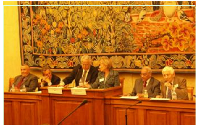
Réunion du Cercle d'Amitié Franco-Marocain au siège de l'Assemblée Nationale, le 7 novembre 2005.

Cette manifestation a été également marquée par la présence de nombreuses personnalités marocaines et françaises, notamment M. Mezouar, Ministre de l'Industrie, du Commerce et de la Mise à Niveau de l'Economie, M Dutreuil, Ministre français de la PME, M. Chevenement, Ancien Ministre de l'Intérieur.