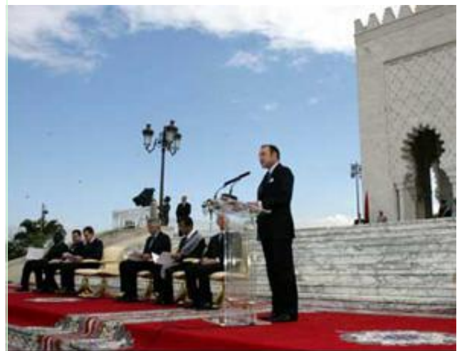
SM Le Roi Mohammed VI lors de la Cérémonie du Cinquantenaire, le 16 novembre à Rabat

Nous exprimons, par ailleurs, Notre profonde reconnaissance aux hommes et aux femmes du mouvement national, de la résistance et de l'armée de libération qui ont tant donné pour défendre la patrie et le symbole de sa souveraineté.